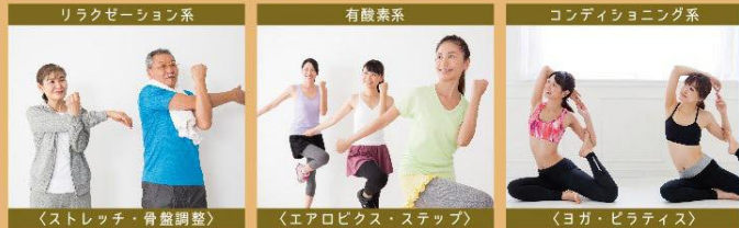
〈ストレッチ・骨盤調整〉 〈エアロピクス・ステップ〉 〈ヨガ・ピラティス〉

綱渡りのような器具を使い、楽しみながらトレーニング/シェイプアップ効果もあります。